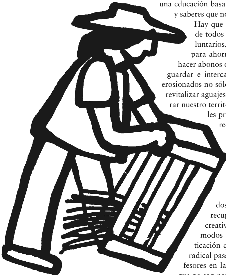
Ilustración: Rini Templeton