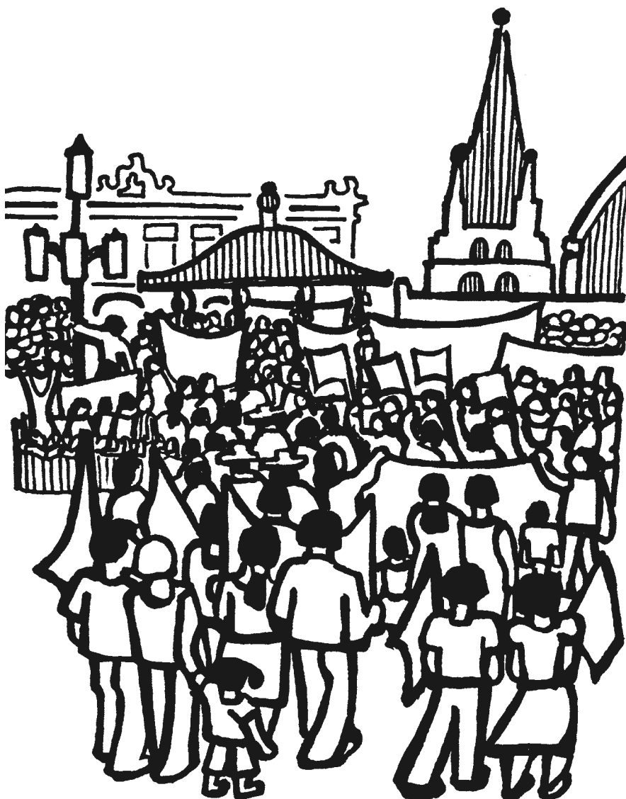
Ilustración: Rini Templeton

8. Entender nuestra verdadera soberanía. Esos espacios para pensar juntos también sirven para reafirmar entre todas las personas que conviven “hasta dónde nos quieren quitar lo que somos, hasta dónde nos quieren arrebatar nuestra soberanía, nuestra autodeterminación”, dice la gente.